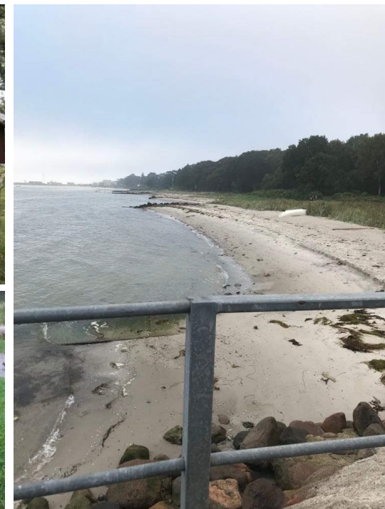
Smuk natur - sjove dage